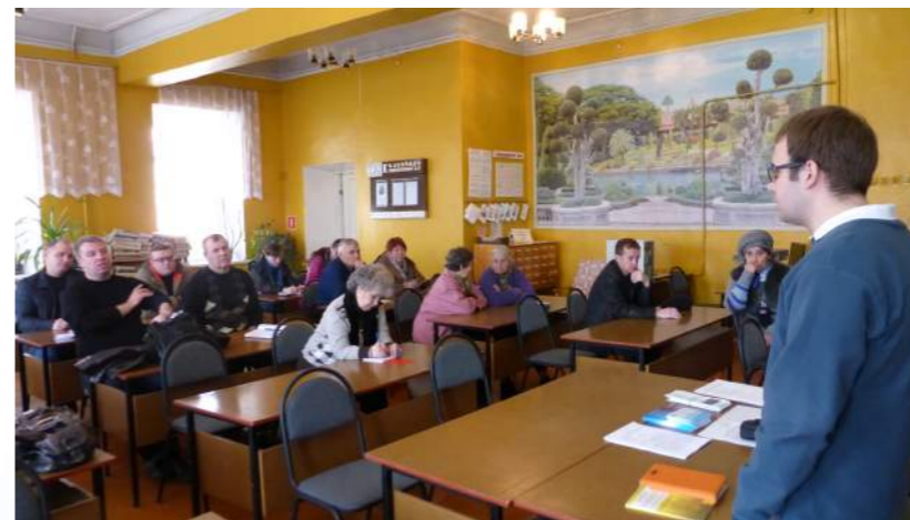
Центры правовой информации районных библиотек