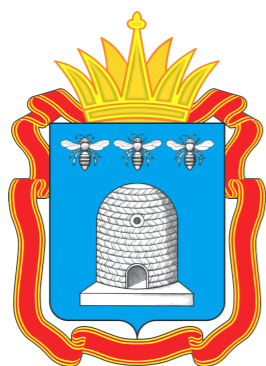
Администрация Тамбовской области